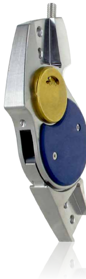
Tableau des dimensions : articulation du genou pour orthèses

Nous offrons aux professionnels la possibilité de réaliser une orthèse Prepreg avec articulation du genou SPL2. N'hésitez pas à demander des informations détaillées et des données de commande auprès de notre Service Clients ou par Internet sous basko.com .