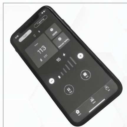
Steuerung über Smartphone-App