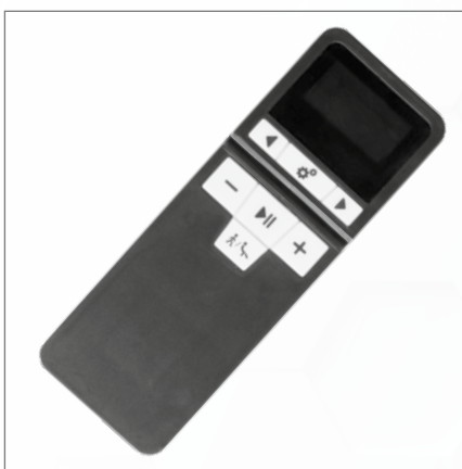
Steuerung über Fernbedienung